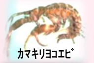
カマキリヨコエビ