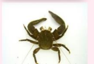
フトウデネジレカニダマシ