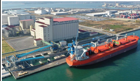
『国際バルク戦略港湾』水島港

※2 令和5年5月22日付 中国地方整備局港湾空港部 記者発表資料を参照ください。