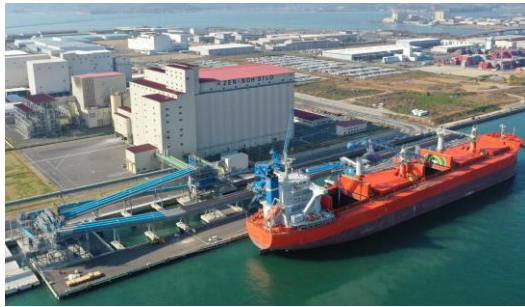
『国際バルク戦略港湾』水島港

※ 大型船によりバルク貨物（ばら積み貨物）を一括大量輸送するための拠点となる港湾