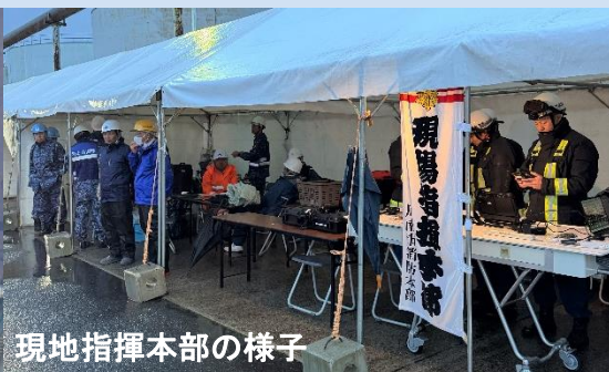
現地指揮本部の様子