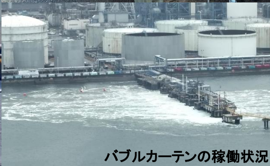
バブルカーテンの稼働状況