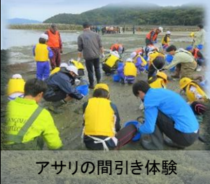
アサリの間引き体験