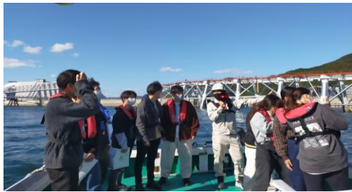
船で徳山下松港を見学する様子