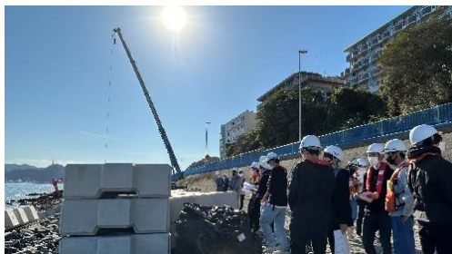
下関港海岸見学の様子