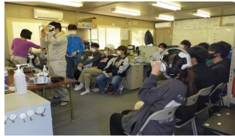
VRによる施工シミュレーションの様子

※今回の見学工事：徳山下松港下松地区棧橋(-19m)上部等工事、同(その2)工事