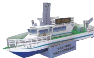
港湾業務艇「おおつ」