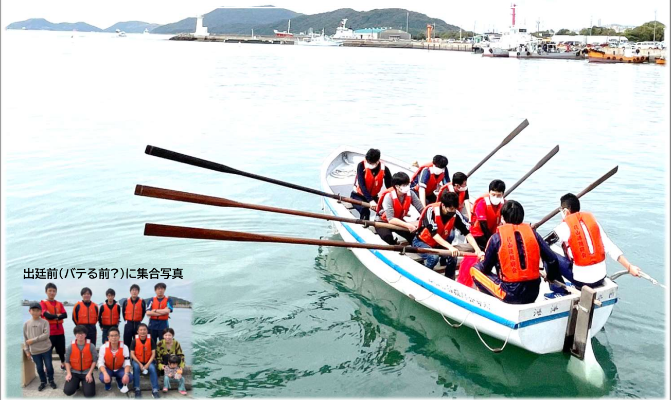
出廷前(バテる前?)に集合写真

10月8日、徳山下松港開港100周年記念イベントのカッター競技大会に事務所で参加しました。出場18チームによる300mのタイムレース。見事に2位でした！後ろから(T_T)前週に15分だけ練習した時には、本番ゴールできるかも怪しい状況でしたが、当日は一致団結し、完走することができました。地域のイベントに参加するのは楽しいですね♪ 来年こそは、目指せ、予選突破！？