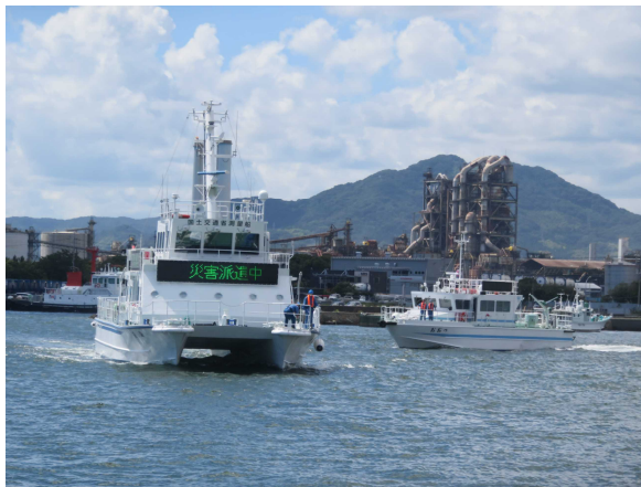
【港湾業務艇による調査状況】