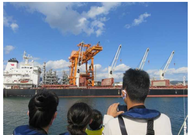
～間近で見る荷役機械～