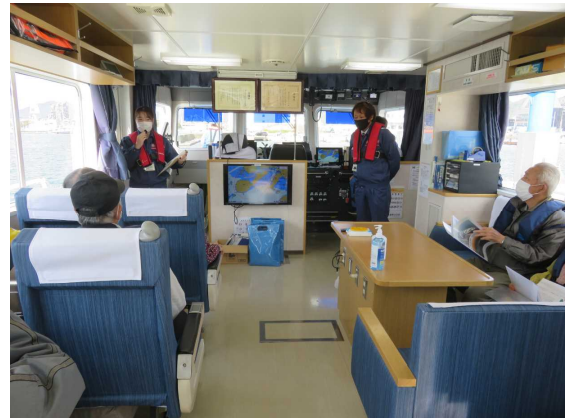
～事務所職員による港のガイド～