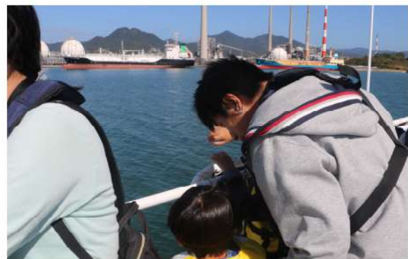
～間近で見る大型貨物船～