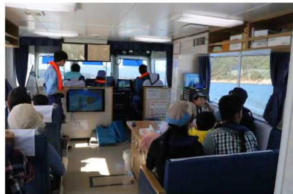
～事務所職員による港のガイド～