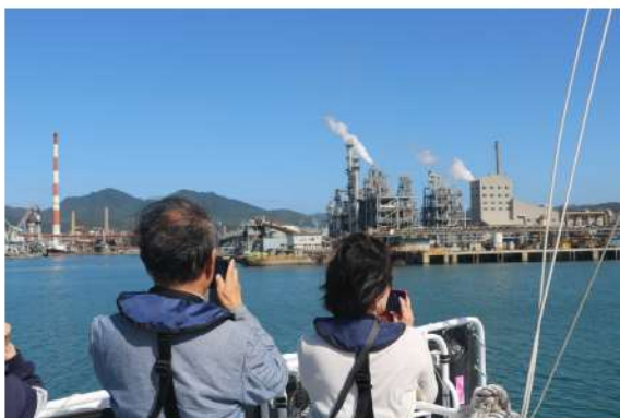
～日本有数の工場地帯を船上から～