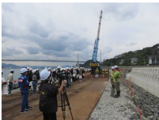
下関港海岸見学の様子