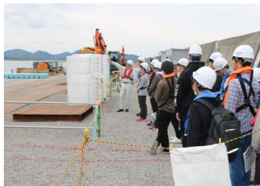
工事現場見学の様子