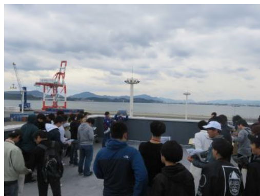
長州出島見学の様子