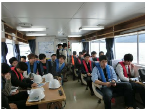
船で徳山下松港を見学する様子