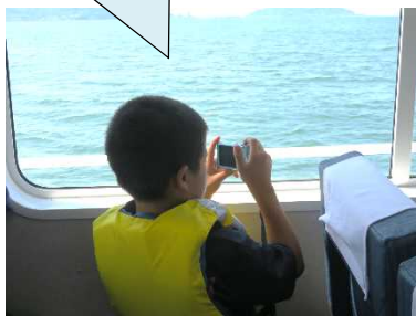
みなとのクイズや船なぞなぞで盛り上がりました！

今年は夏休み序盤に開催したこともあり、「夏休みの自由研究にする!」と言って写真を撮っている子供がたくさんいました。