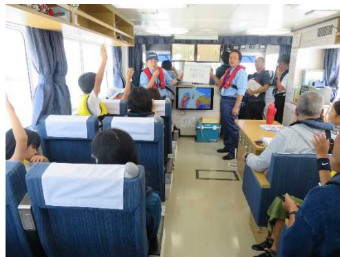
みなとのクイズや船なぞなぞで盛り上がりました！