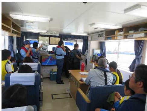
みなとの大切さや船の役割を説明