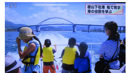
メディアも取材に訪れ、テレビや新聞で取り上げられました。

宇部港湾・空港整備事務所では今後も引き続き、“みなと”の役割や重要性を幅広く皆さんに伝える取組みを継続してまいります。