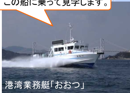
港湾業務艇「おおつ」