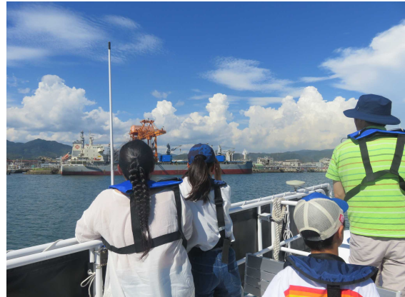
間近で大型貨物船を見学