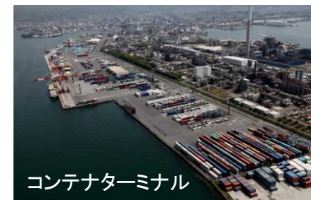
コンテナターミナル