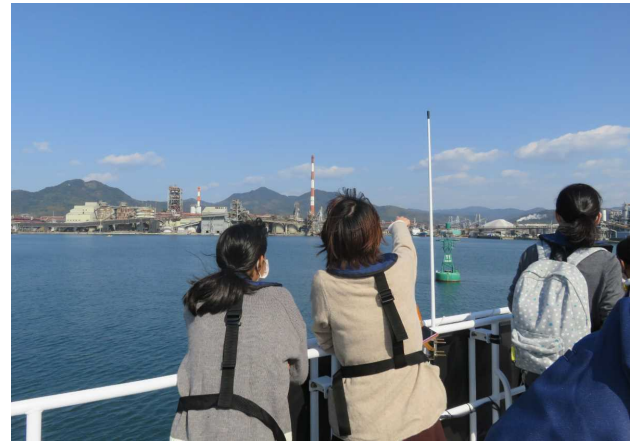
間近で見る荷役機械の大きさにびっくり