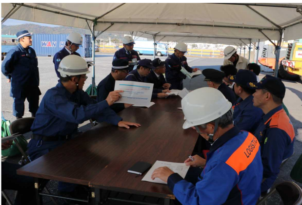
合同点検開催状況