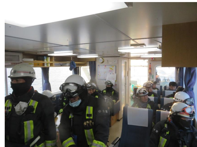
17時5分 消防隊員輸送状況