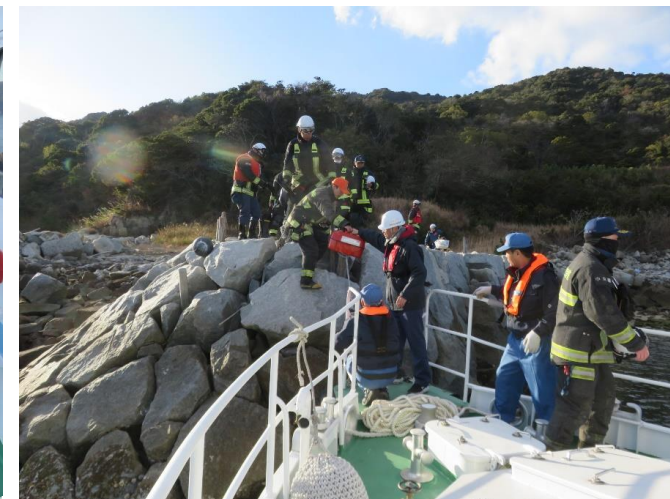
17時頃 隊員帰還のため太刀浦にて乗船