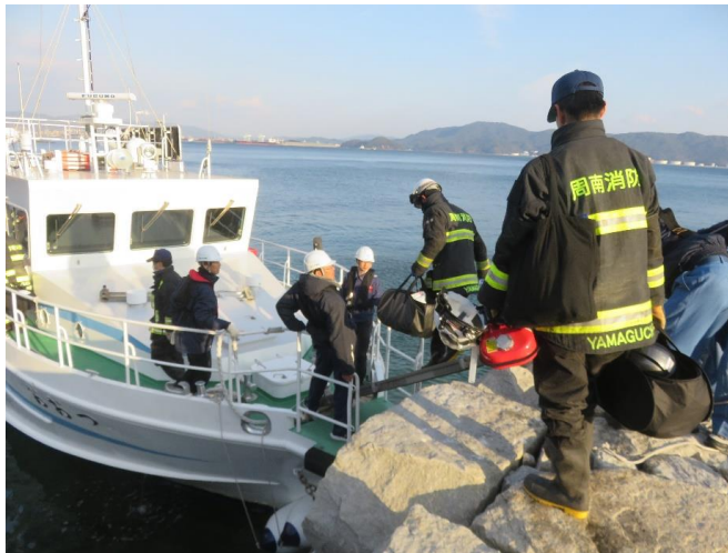
16時20分 隊員帰還のため太刀浦にて乗船