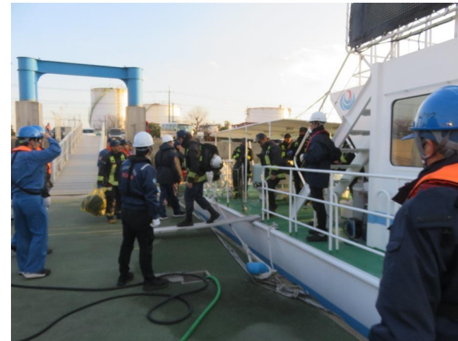
16時50分 おおつ桟橋にて下船