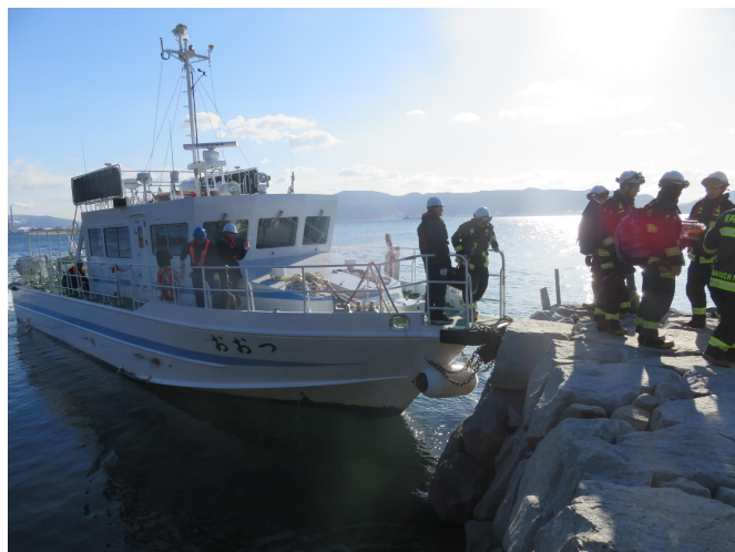
9時半頃 太刀浦にて隊員下船