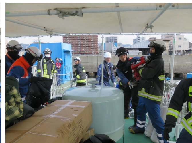
おおつ 棧橋にて物資の荷下ろし