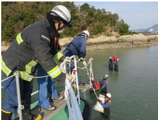
10時頃 海岸から消防活動に使用した資機材回収(積み込み)