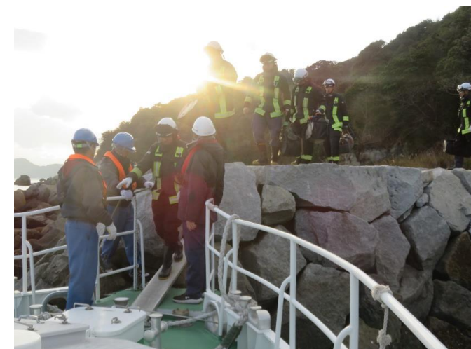
16時30分 太刀浦にて隊員乗船