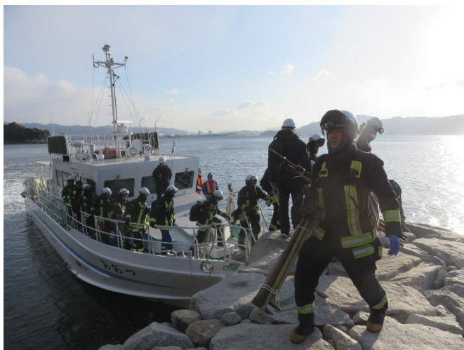
8時45分 太刀浦にて隊員下船