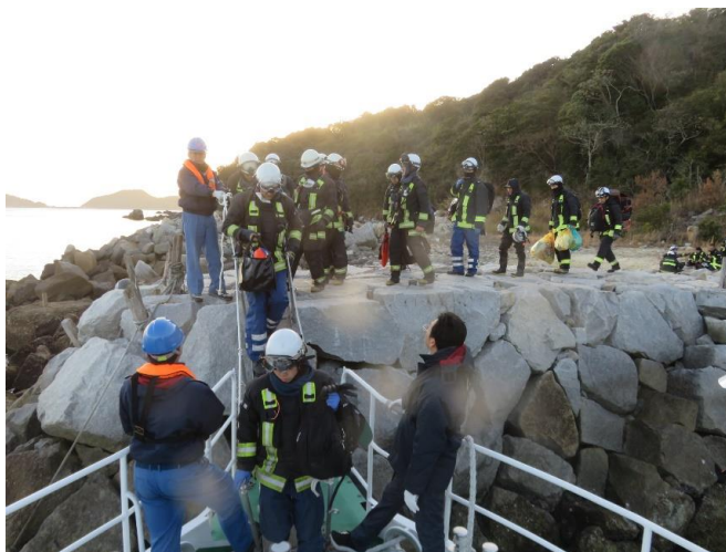
17時00分 隊員帰還のため太刀浦にて乗船