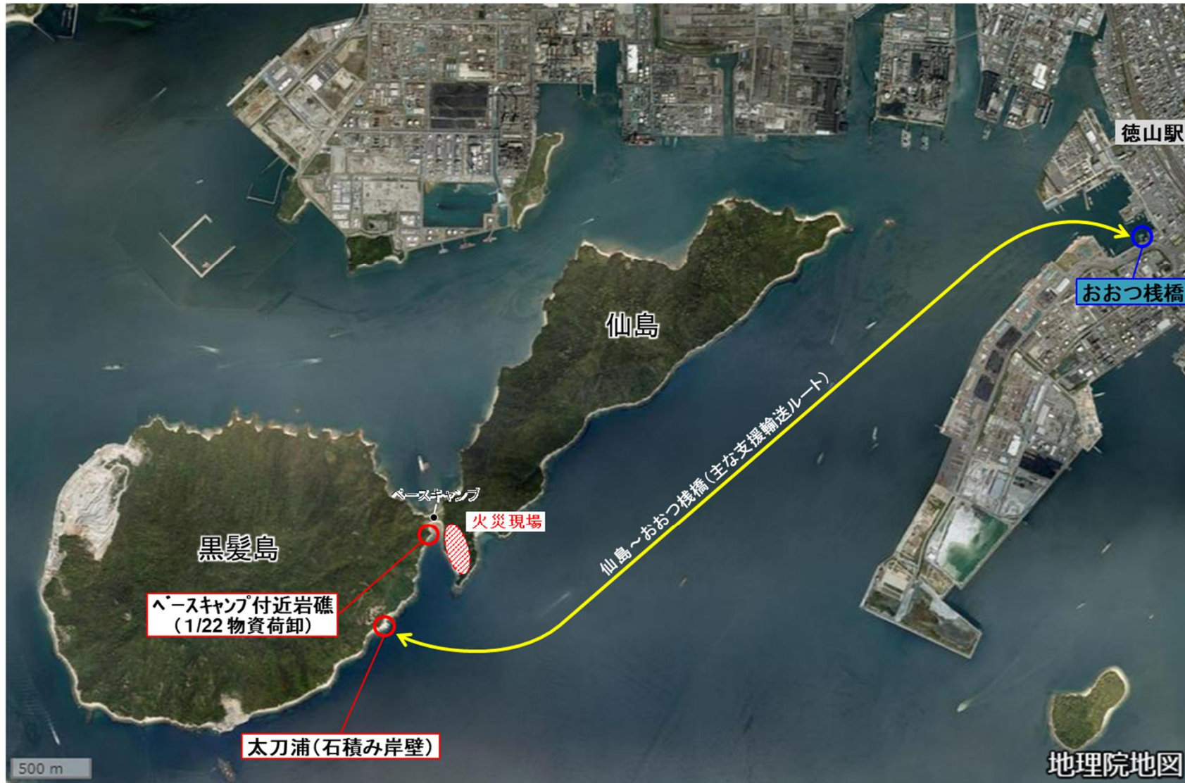
仙島火災状況(1/22、10時時点)