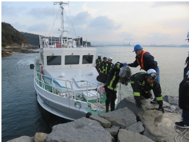
8時45分 太刀浦にて隊員下船