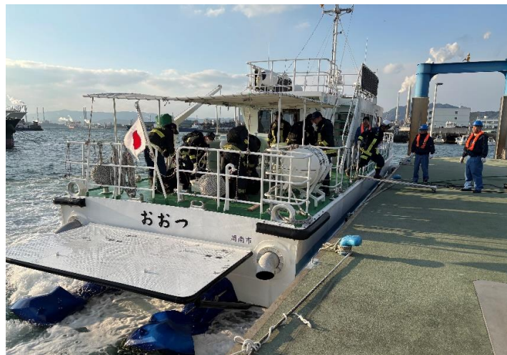
16時15分 おおつ桟橋にて隊員下船。直ちに出航