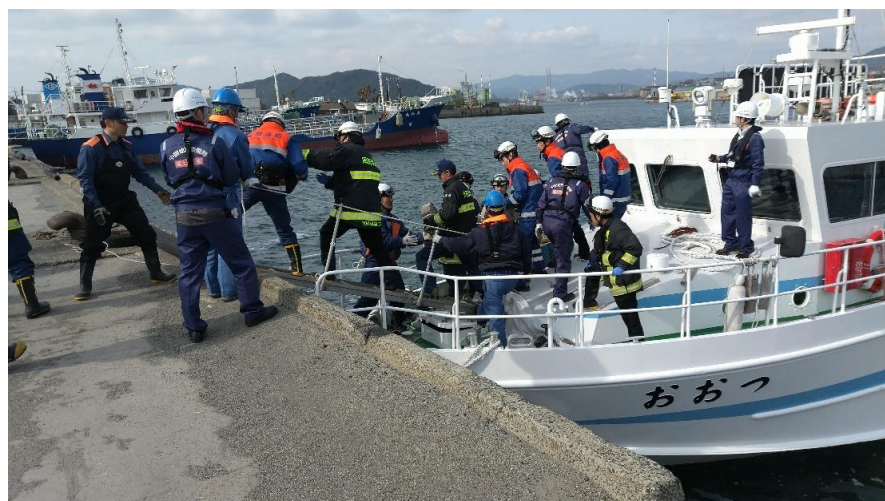
11時04分 基地港の岸壁にて物資の荷下ろし