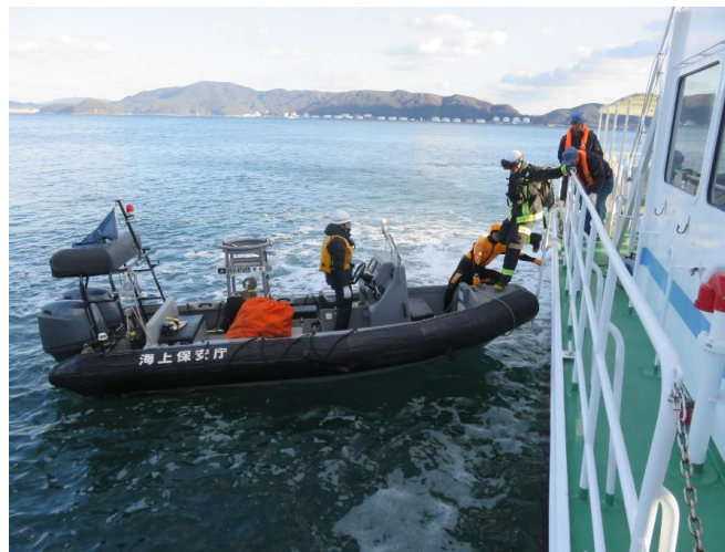
16時頃 ボートに乗り換え仙島へ上陸