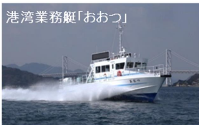
港湾業務艇「おおつ」