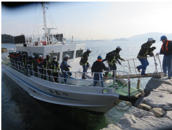
9時15分 太刀浦にて隊員下船