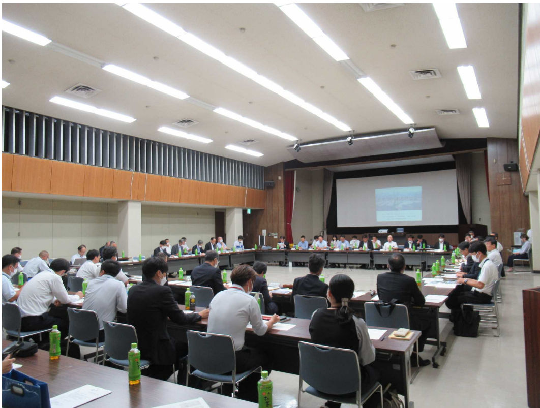
広島港利用者懇談会 開催状況