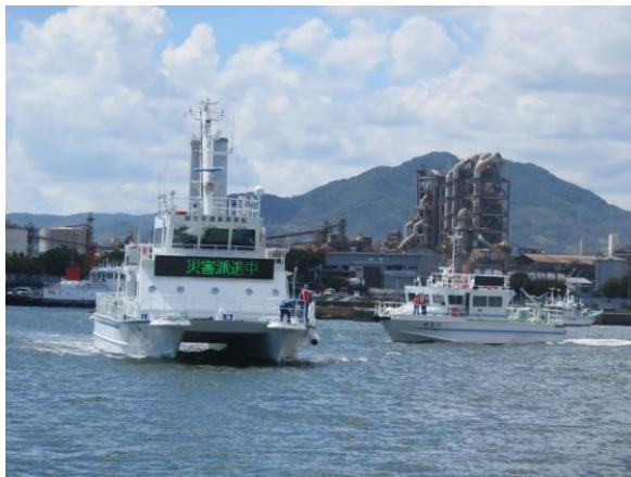
【港湾業務艇による調査状況】