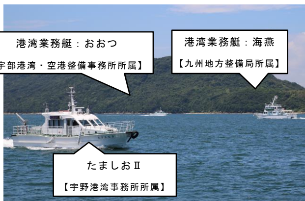
【港湾業務艇 調査状況】