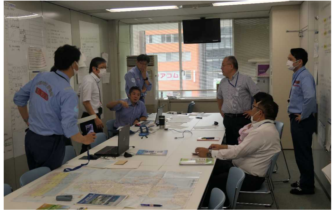
九州地整と打合せ

○先遣班は、周防灘の漂流物の状況等について情報収集するため、九州地整と打合せを実施。