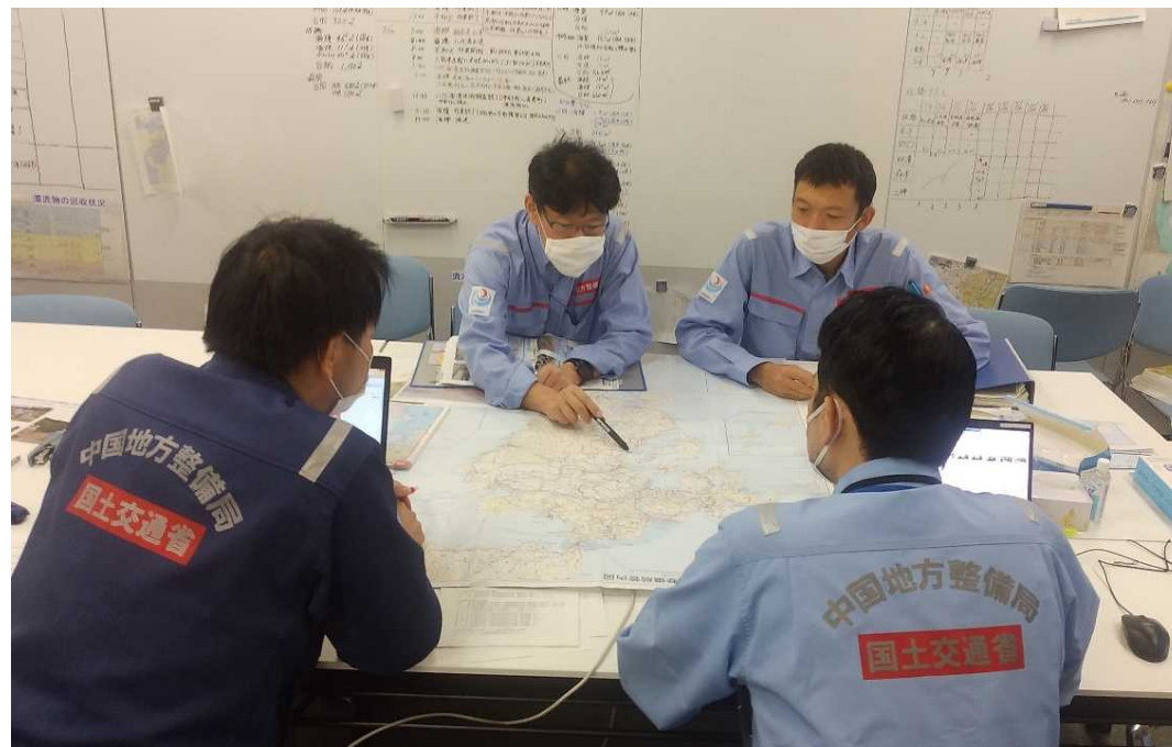
九州地整と打合せ