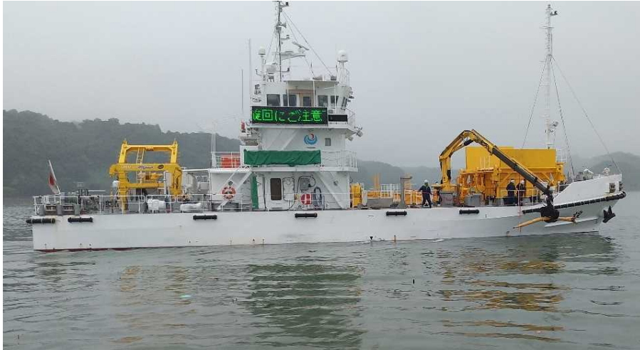
海洋環境整備船「海煌」による漂流物回収状況