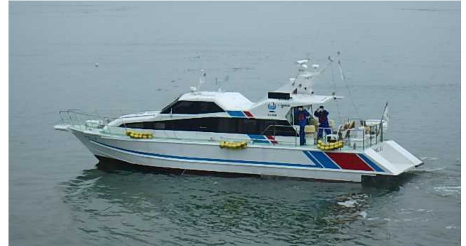
漂流物の調査状況