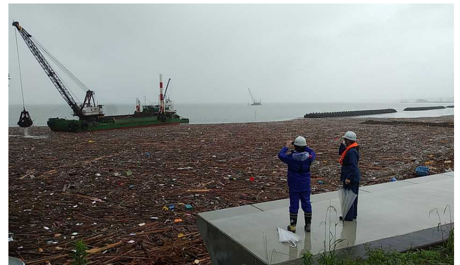
宇土半島近傍の漂流物撤去作業の確認