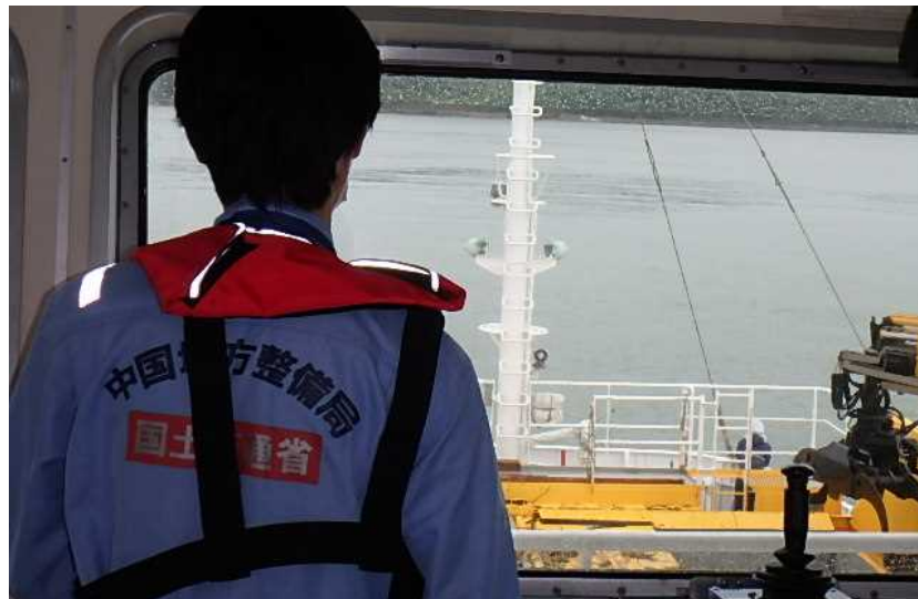
漂流物回収作業の確認