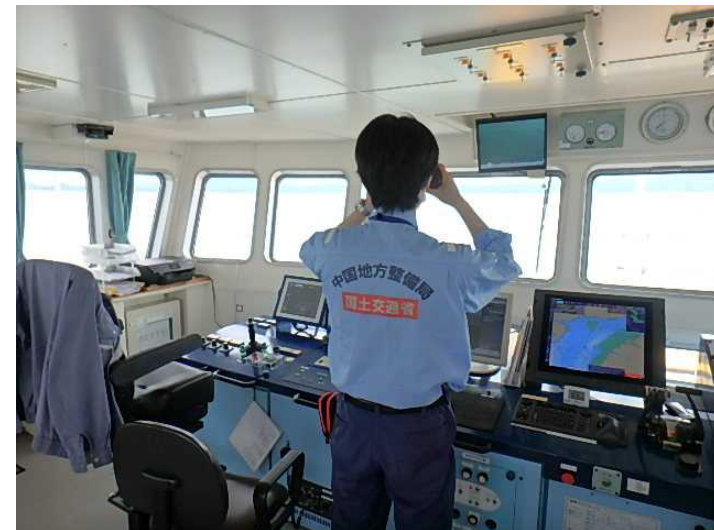
漂流物の調査状況(船上から)