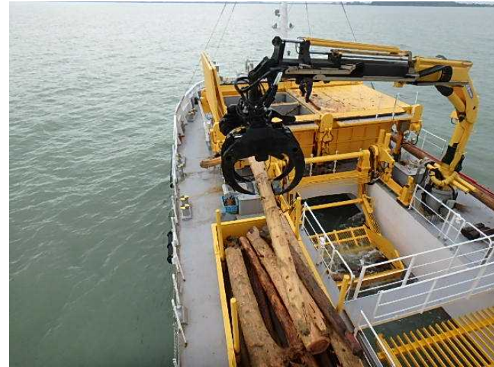
海洋環境整備船「海煌」による漂流物回収状況