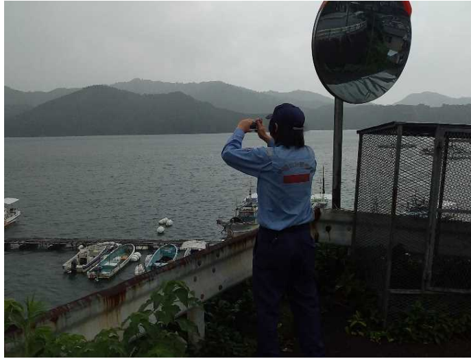
漂流物の調査状況(陸域から)