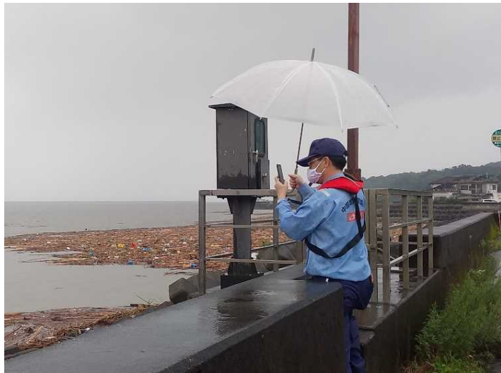
宇土半島近傍の漂流物撤去作業の確認