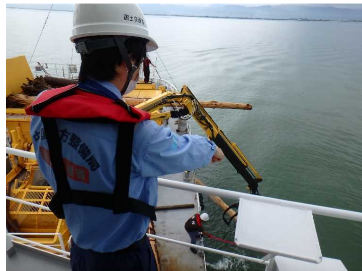
漂流物回収の指示