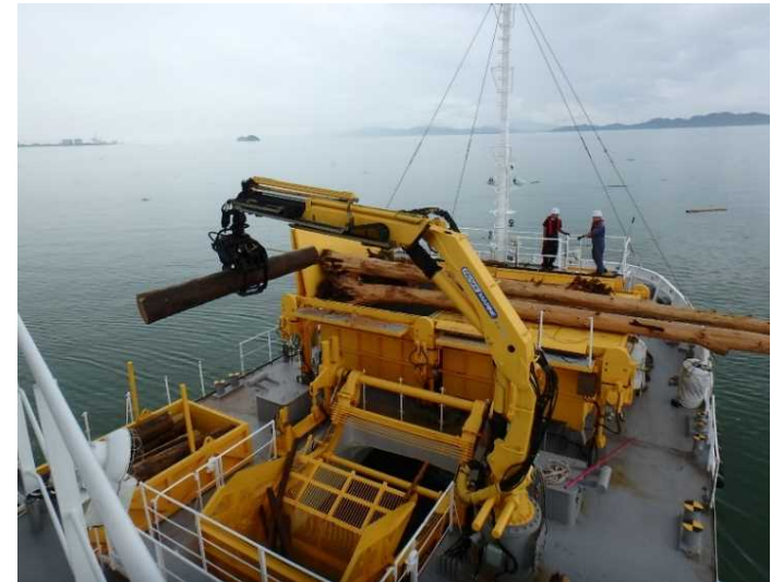
海洋環境整備船「海煌」による漂流物回収状況