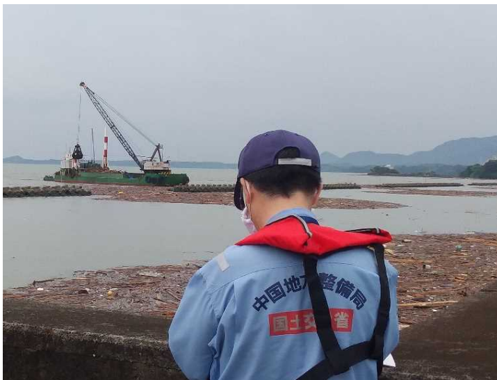
宇土半島近傍の漂流物撤去作業の確認