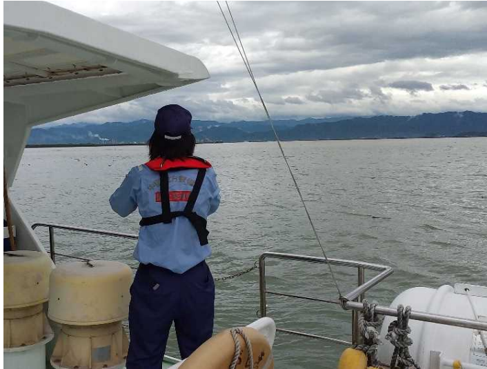
漂流物の確認状況