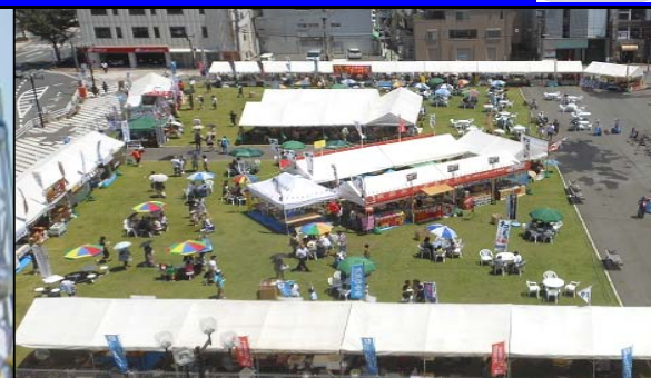
みなとオアシスフェスティバルin三原