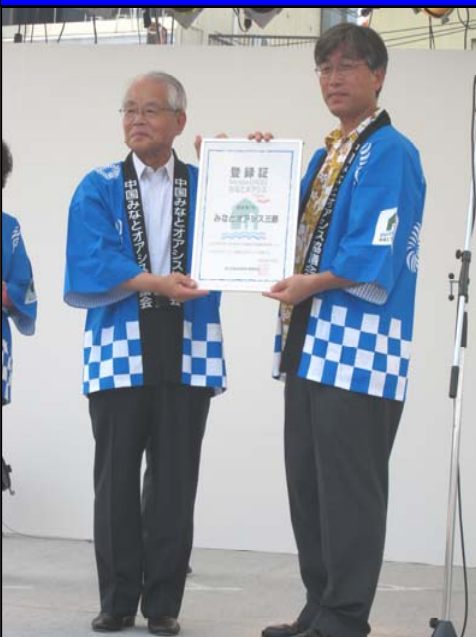
登録証交付 (左:五藤三原市長、右:西植副局長)