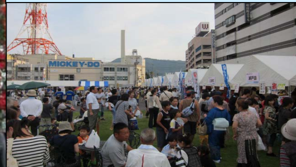
第一回みなとオアシスSea級グルメ全国大会in三原