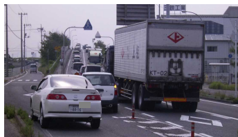
水玉ブリッジラインの混雑状況