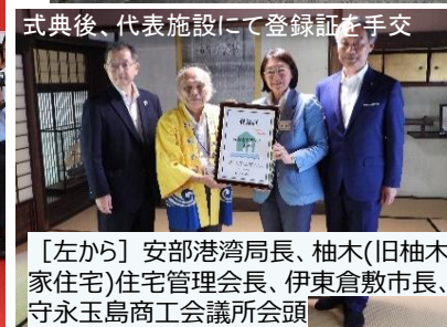
式典後、代表施設にて登録証を手交