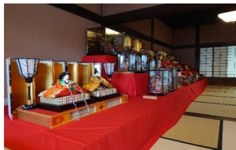
倉敷雛めぐり(玉島地区)