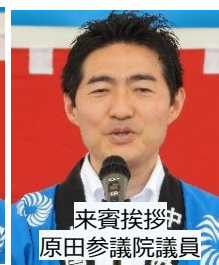
来賓挨拶 原田参議院議員