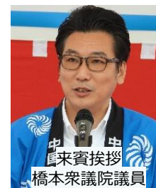
来賓挨拶 橋本衆議院議員