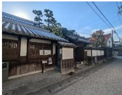
旧柚木家住宅(西爽亭) (みなとオアシス玉島)