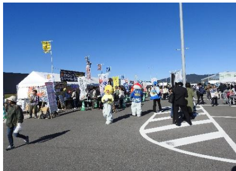
地域振興イベントの開催状況 (Sea級グルメ全国大会in境港) (みなとオアシス境港)