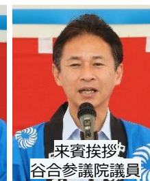
来賓挨拶 谷合参議院議員