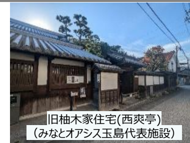
旧柚木家住宅(西爽亭) (みなとオアシス玉島代表施設)