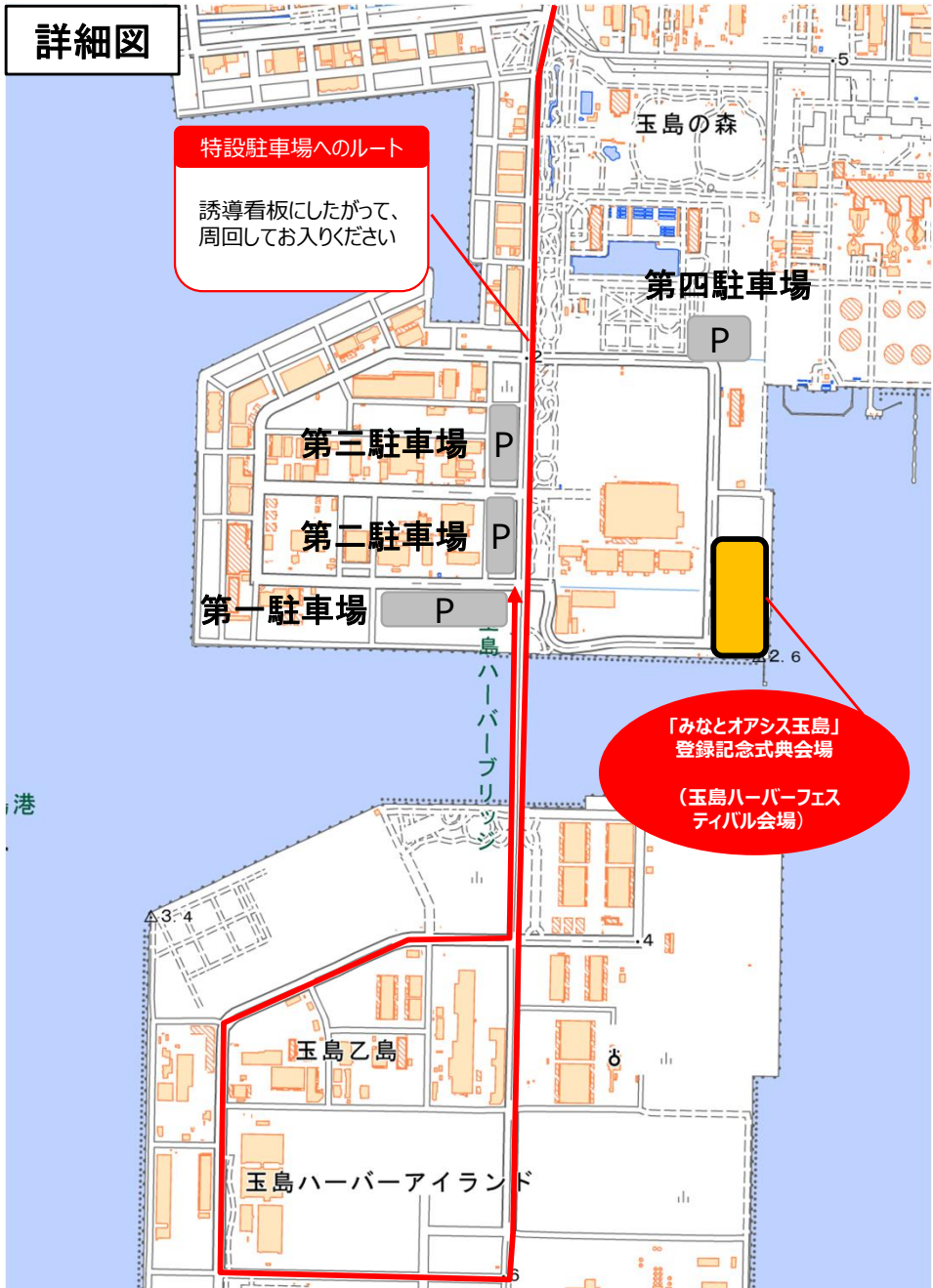
国土地理院地図（電子国土Web）( https://maps.gsi.go.jp )をもとに作成

「みなとオアシス玉島」登録記念交付式典会場への交通アクセス <車> ○山陽自動車道玉島ICから約20分 （特設駐車場あり。設置してある案内看板にしたがって駐車ください。） 「みなとオアシス玉島」の問合せ先 玉島商工会議所 TEL：086-526-0301