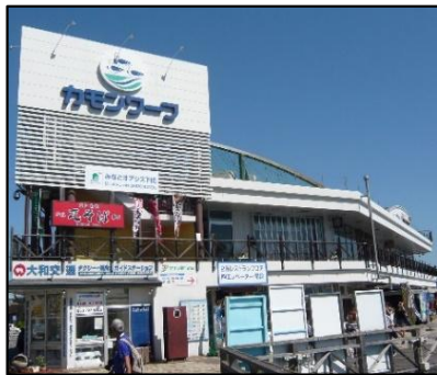
構成施設のイメージ (下関港、カモンワーク)