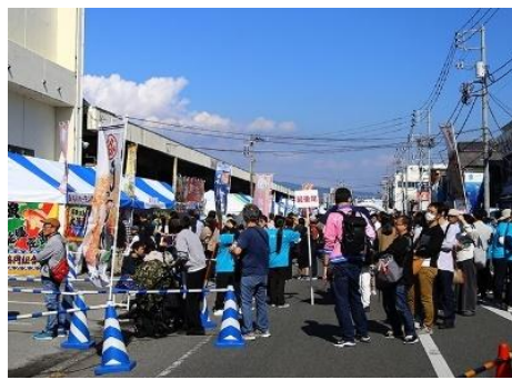
地域振興イベントの開催状況 (Sea級グルメ全国大会in沼津)