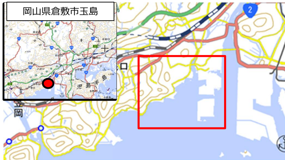
国土地理院地図（電子国土Web）( http://maps.gsi.go.jp )をもとに作成