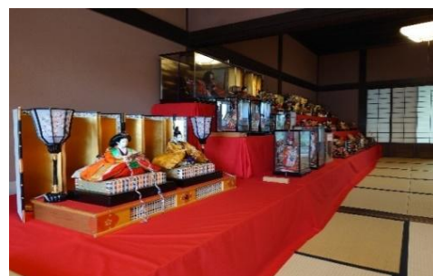
倉敷雛めぐり(玉島地区)