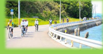
かしま海道サイクリングロード推奨ルート