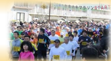
江田島市かきカキマラソン大会