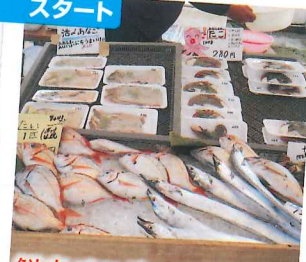
鮮度バツグンの旬のおさかな大集合! 周防大島産のおさかなが勢揃い! 今が旬のイキのいいおさかなを特売!