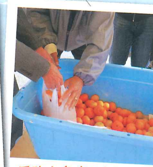
周防大島産ミカンつかみ取りコーナー