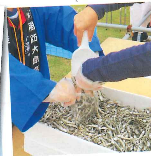
山口県産イリコ詰め放題コーナー