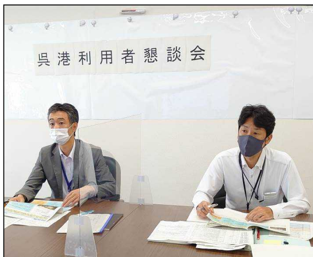
[中国地方整備局港湾空港部会議室]