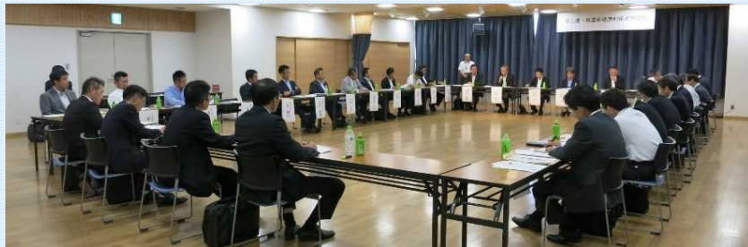
利用者の声を聞き、物流の更なる効率化を目指します