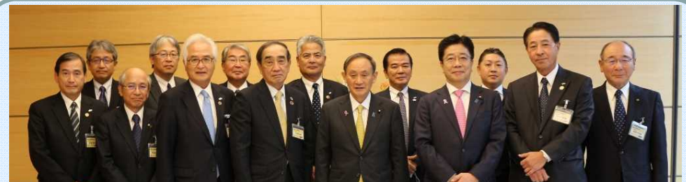
中国地方国際物流戦略チーム有志一同による政府への要望活動状況(R2.11.25)