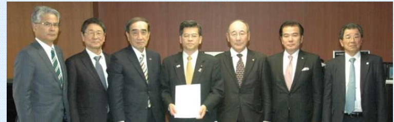
中国地方国際物流戦略チーム有志一同による政府への要望活動状況(H29.11.16)