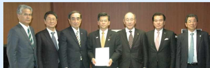
中国地方国際物流戦略チーム有志一同による政府への要望活動状況(H29.11.16)