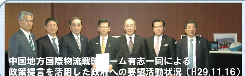
中国地方国際物流戦略チーム有志一同による政策提言を活用した政府への要望活動状況 (H29.11.16)