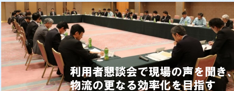
利用者懇談会で現場の声を聞き、物流の更なる効率化を目指す