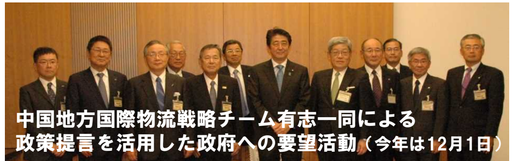
中国地方国際物流戦略チーム有志一同による 政策提言を活用した政府への要望活動（今年は12月1日）