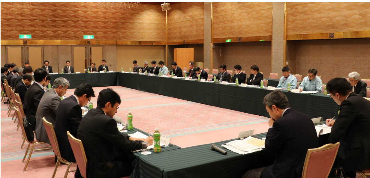
岩国港・大竹港利用者懇談会 開催状況