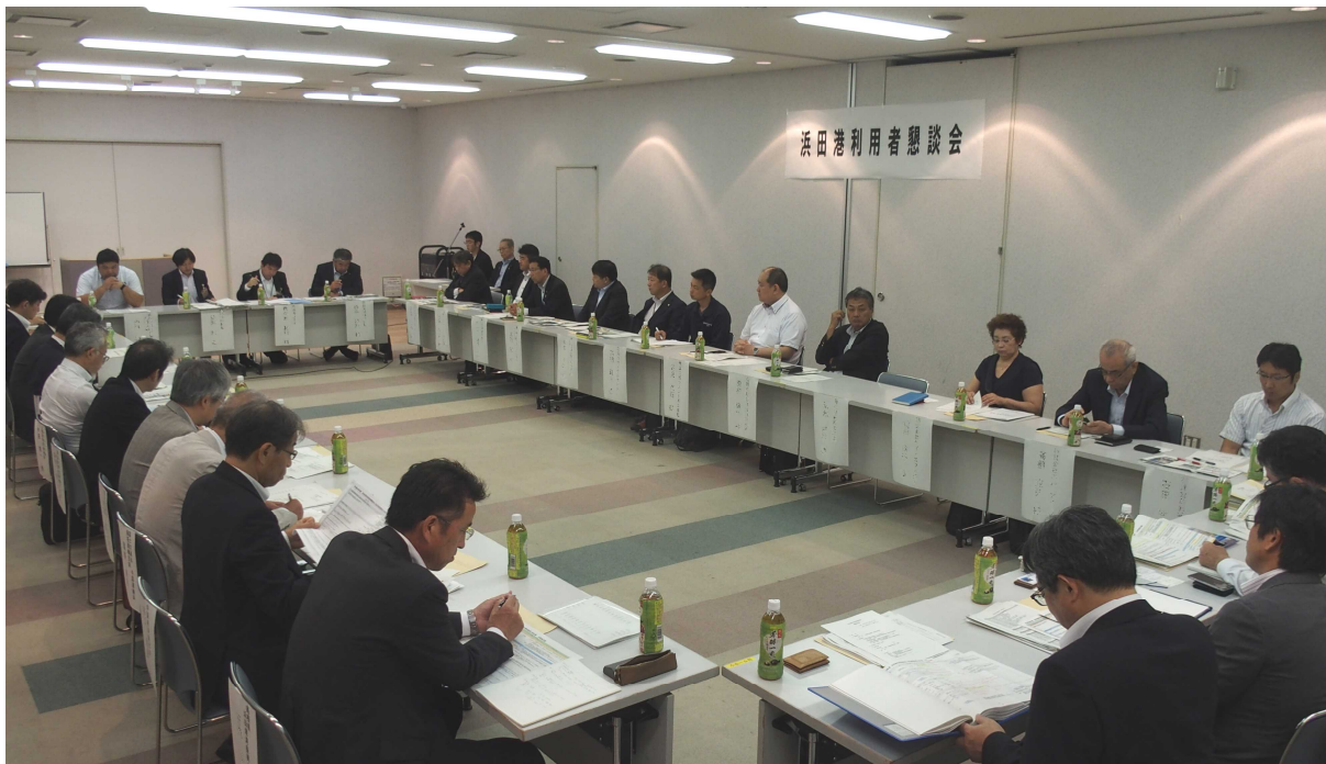
浜田港利用者懇談会 開催状況