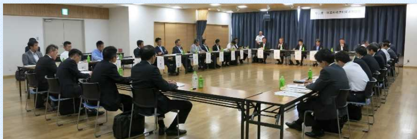
利用者の声を聞き、物流の更なる効率化を目指します