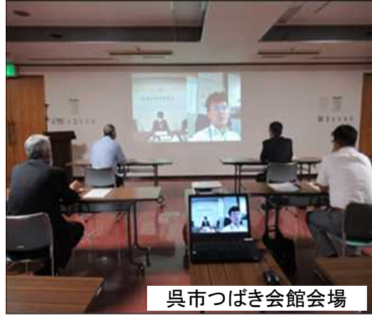
呉市つばき会館会場