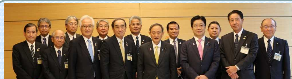
中国地方国際物流戦略チーム有志一同による政府への要望活動状況(R2.11.25)