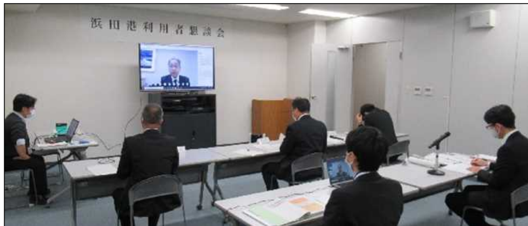
浜田港利用者懇談会 開催状況