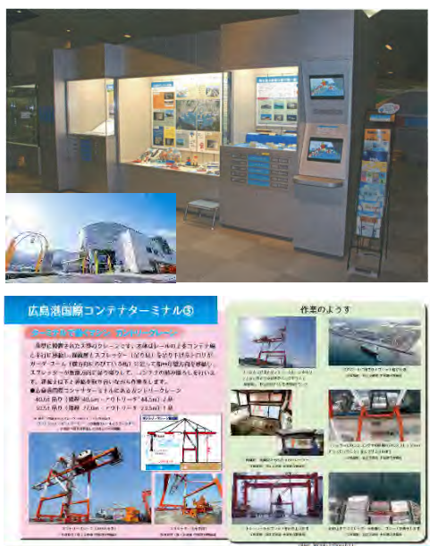
ママジ交通ミュージアム（広島市交通科学館） 関係資料の展示