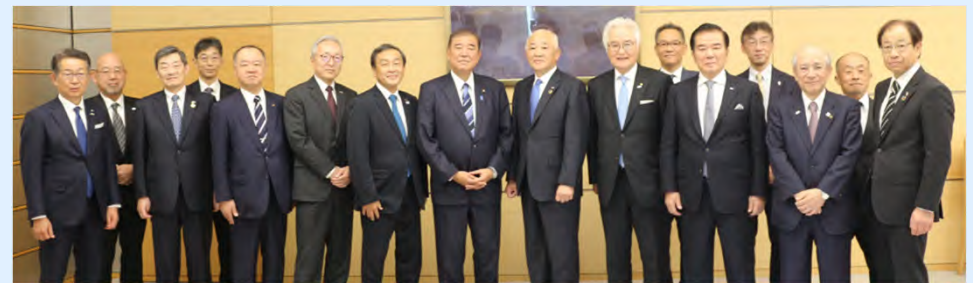
中国地方国際物流戦略チーム有志一同による政府への要望活動状況(R6.11.27)