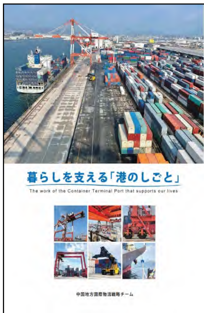
PR動画・パンフレット作成