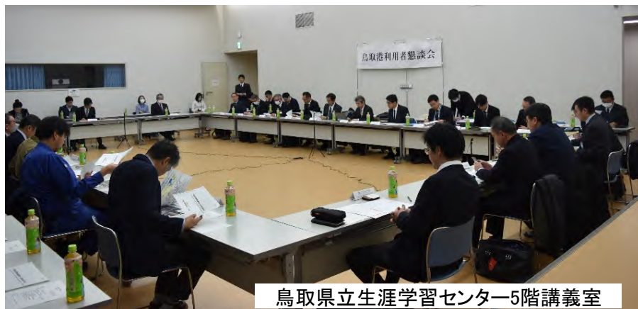
鳥取県立生涯学習センター5階講義室