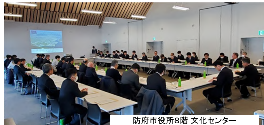
防府市役所8階文化センター