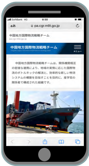
国際物流戦略チームHP（スマホ対応）