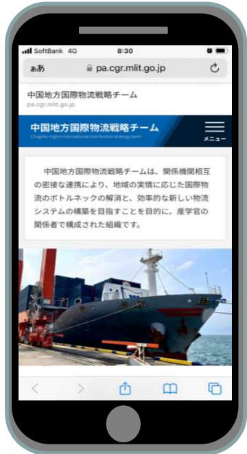
国際物流戦略チームHP（スマホ対応）