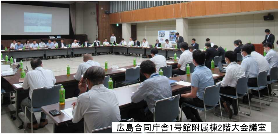
広島合同庁舎1号館附属棟2階大会議室