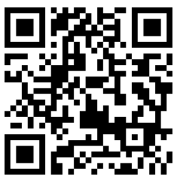
戦略チームHPはこちら