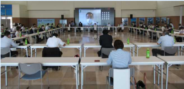
利用者の声を聞き、物流の更なる効率化を目指します