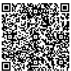
ガイドラインはこちら