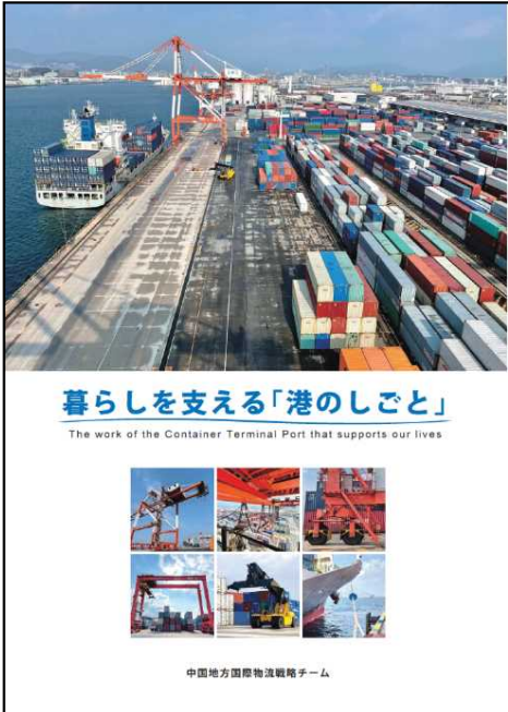
PR動画・パンフレット作成