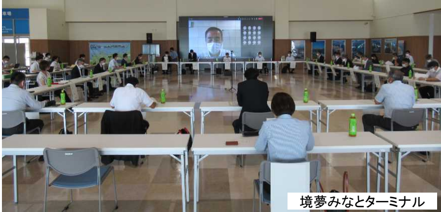
境夢みなとターミナル