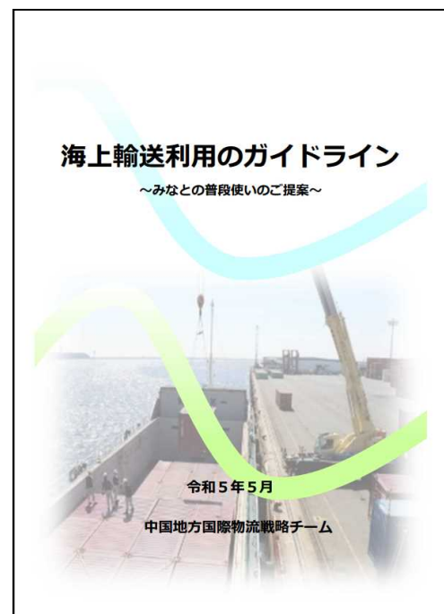
海上輸送利用のガイドライン【管内版】