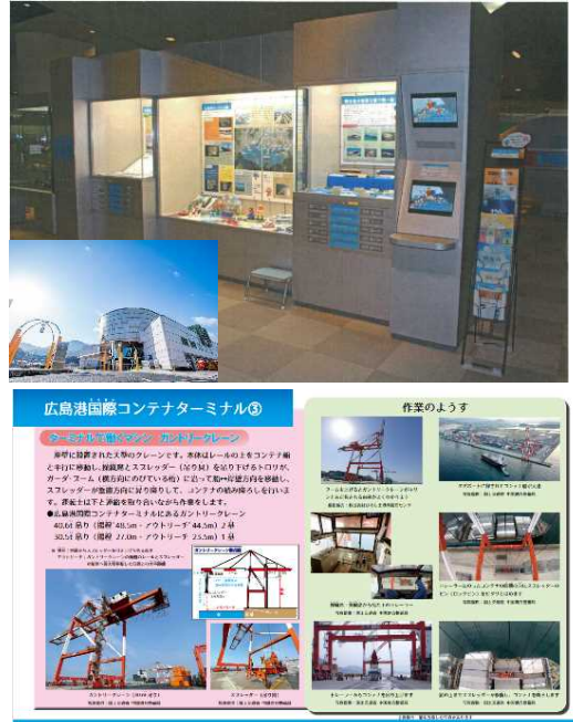
ママジ交通ミュージアム（広島市交通科学館） 関係資料の展示