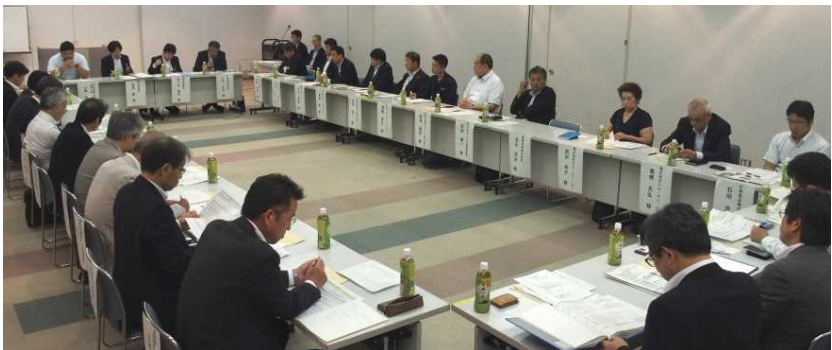
利用者懇談会の様子