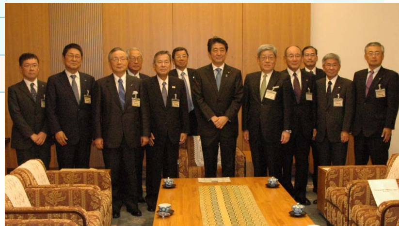
安倍総理大臣との面談