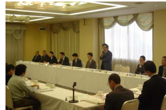
利用者懇談会の様子