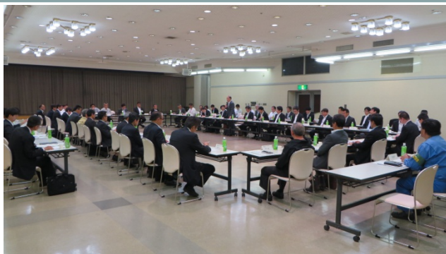
利用者懇談会の様子