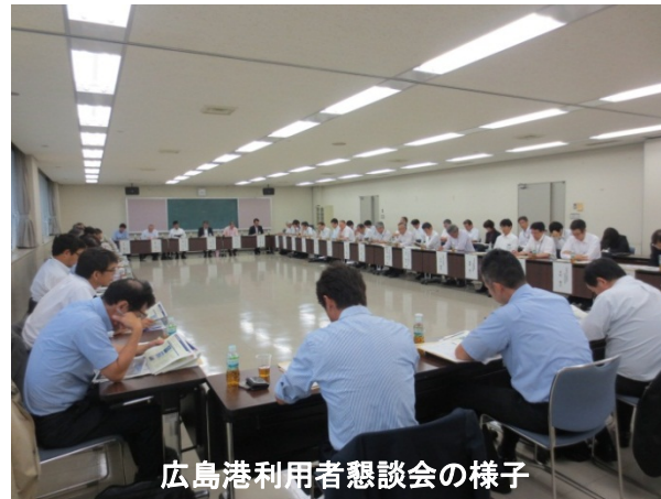
広島港利用者懇談会の様子