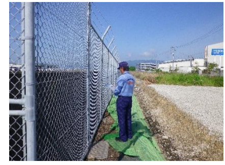
巡視状況(五日市(-11m,-12m)岸壁)