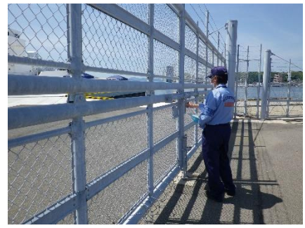
巡視状況(宇品外貿埠頭)