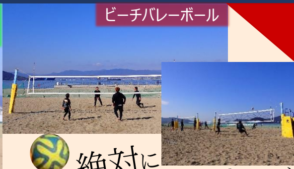
ビーチバレーボール