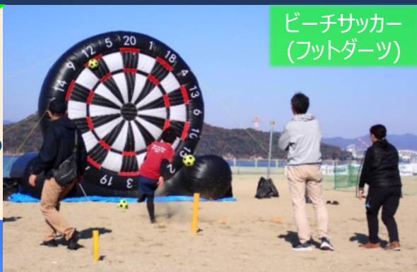
ビーチサッカー (フットダーツ)