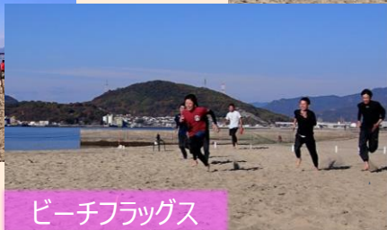
ビーチフラッグス