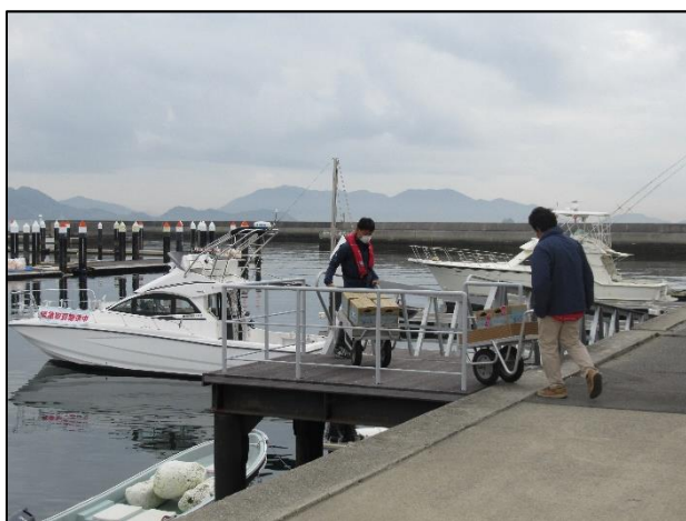
搬出元から小型船へ運搬