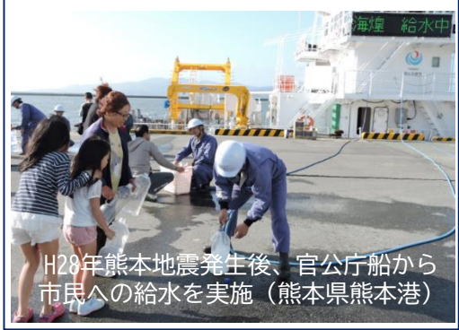
H28年熊本地震発生後、官公庁船から市民への給水を実施 (熊本県熊本港)