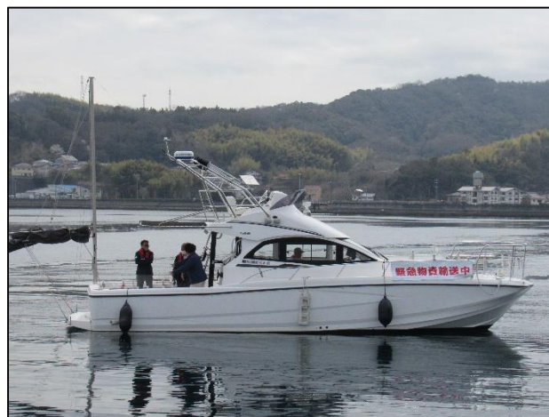
緊急物資輸送中の小型船