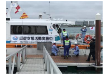
R3年10月に浜名港で実施した、船舶を活用した緊急物資輸送・被災者輸送訓練