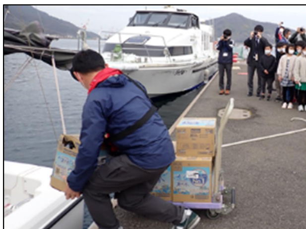
届いた物資の荷下ろし