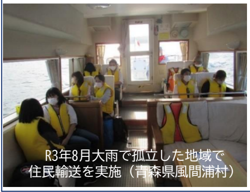
R3年8月大雨で孤立した地域で住民輸送を実施 (青森県風間浦村)