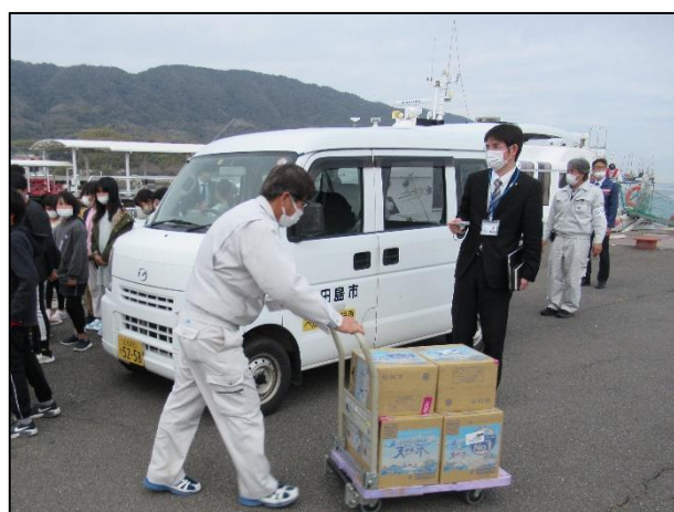
自治体職員への引渡し