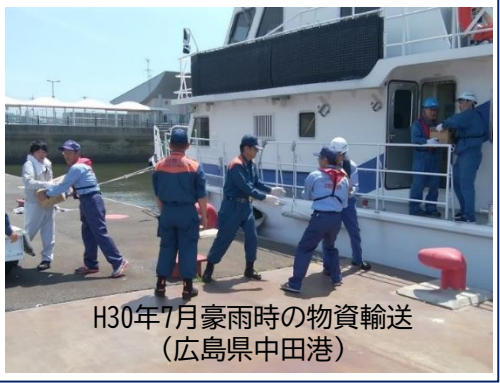
H30年7月豪雨時の物資輸送 (広島県中田港)