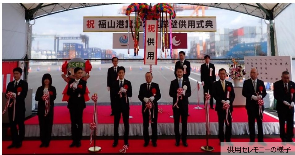
供用セレモニーの様子