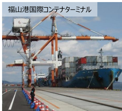
福山港国際コンテナターミナル