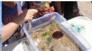
拾ったシーグラスで...