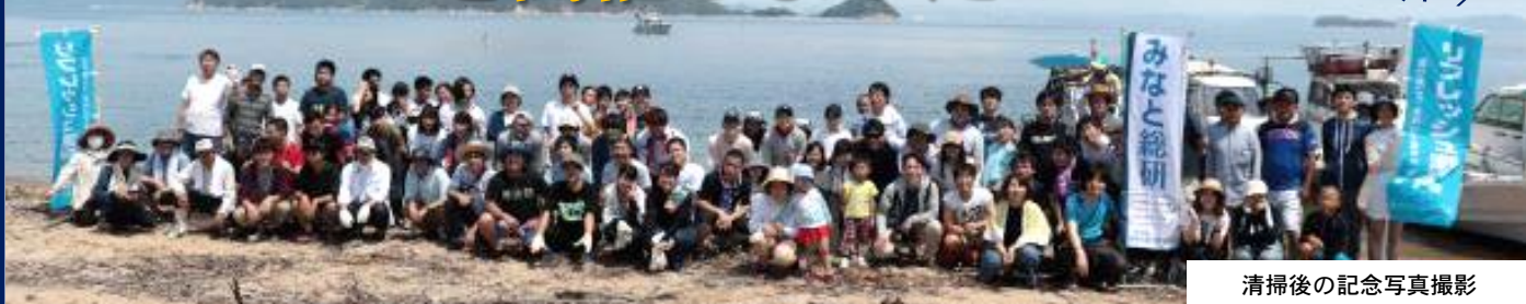
清掃後の記念写真撮影

令和元年7月15日宇治島にて、リフレッシュ瀬戸内※の活動でもある「宇治島サニーアイランドクリーン作戦」を開催しました。広島県福山市に属する宇治島は、澄んだ海に囲まれた自然豊かな無人島である一方、砂浜にはゴミなど無数の漂流物も打ち上げられています。その自然を守り続けるため、毎年海の日「宇治島サニーアイランドクリーン作戦」を開催し、島の清掃活動を行っています。